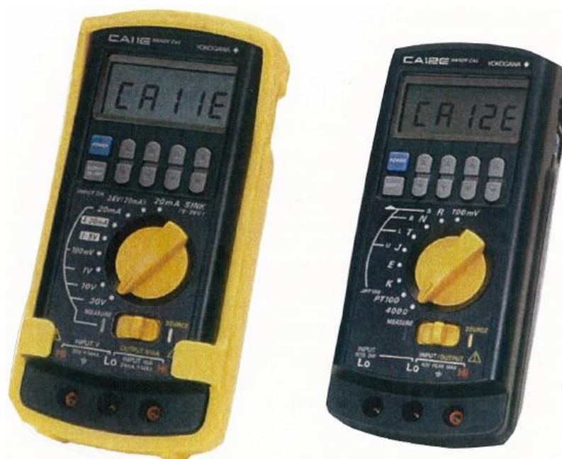
Рисунок 1 – Общий вид калибраторов CA11E, CA12E

На рисунке 1 приведён общий вид калибраторов CA11E, CA12E, на рисунке 2 приведена схема пломбирования калибраторов CA11E, CA12E.