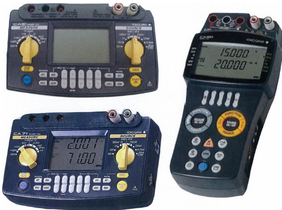
Рисунок 3 – Общий вид калибраторов CA51, CA71, CA150

Калибраторы CA51, CA71, CA150, CA450 состоят из двух рабочих секций (измерение и воспроизведение), работающих независимо друг от друга и гальванически развязанных. Это позволяет использовать калибраторы для одновременного воспроизведения выходного сигнала и измерения входного сигнала. На рисунке 3 приведён общий вид калибраторов CA51, CA71, CA150, 4 - общий вид калибратора CA450, на рисунке 5 - схема пломбирования калибраторов CA51, CA71, CA150, CA450.