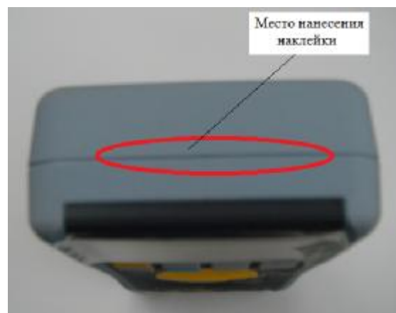
Рисунок 5 – Схема пломбирования калибраторов CA51, CA71, CA150, CA450