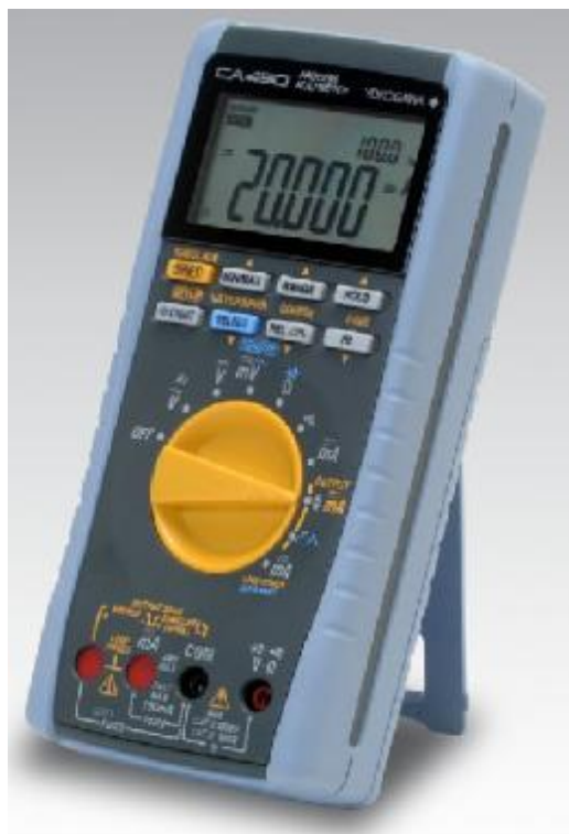
Рисунок 4 – Общий вид калибраторов CA450